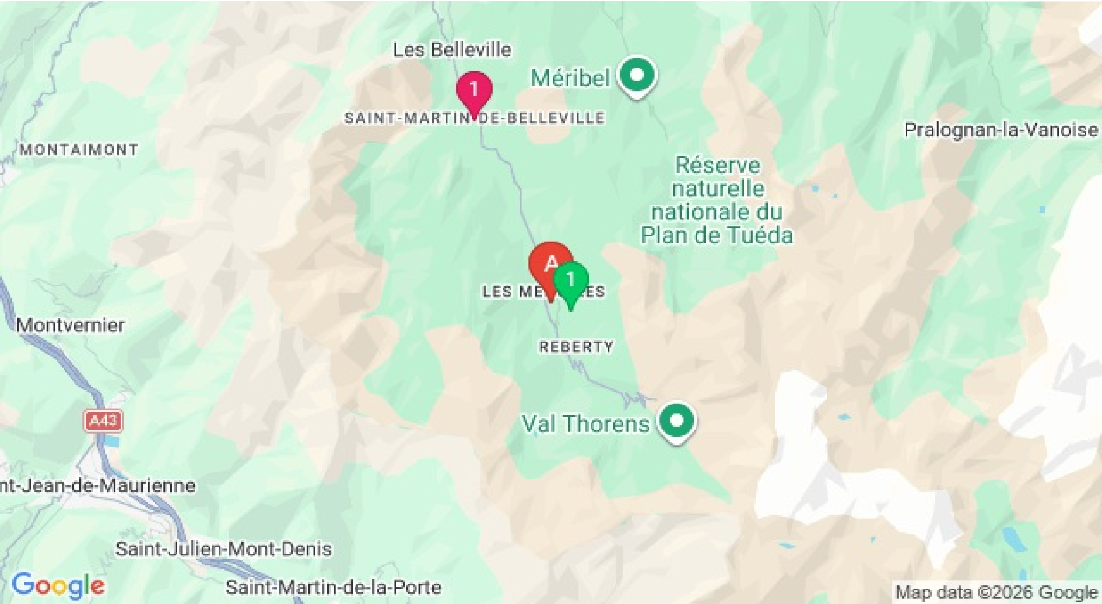
Map data ©2026 Google